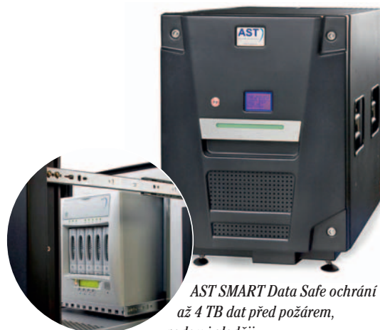
AST SMART Data Safe ochrání až 4 TB dat před požárem, vodou i zloději

Jedná se o vysoce flexibilní řešení s rychlou a čistou instalací, které uvnitř skrývá kompletně vybavené datové centrum formátu jednoho nebo dvou 19" racků – odolnost v ohni je certifikována na 120 minut, ve vodě dle IP67. Cena SMART Bunkeru s rack stojanem 41U, klimatizací, integrovanou UPS a dalšími systémy se pohybuje kolem milionu korun.